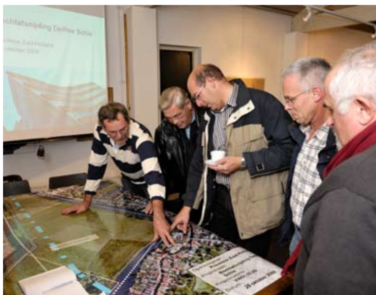
Informatiebijeenkomst bochtafsnijding Delftse Schie

Naast vragen over de noodzaak van een bochtafsnijding en de manier waarop de verschillende tracévarianten tegen elkaar zijn afgewogen, vroegen aanwezigen ook aandacht voor de schade aan de oevers langs de huidige vaarweg. Dit onderwerp wordt door de provincie opgepakt als voorbereiding op de toekomstige herinrichting van de huidige vaarweg. Daarnaast vindt een aantal bewoners een vrij uitzicht over het polderlandschap belangrijk en wil men graag weten in hoeverre recreatie in het huidige landschap extra wordt gestimuleerd. De schetsbijeenkomst op 4 februari 2010 geeft belanghebbenden de mogelijkheid om hun ideeën en wensen hierover in te brengen.